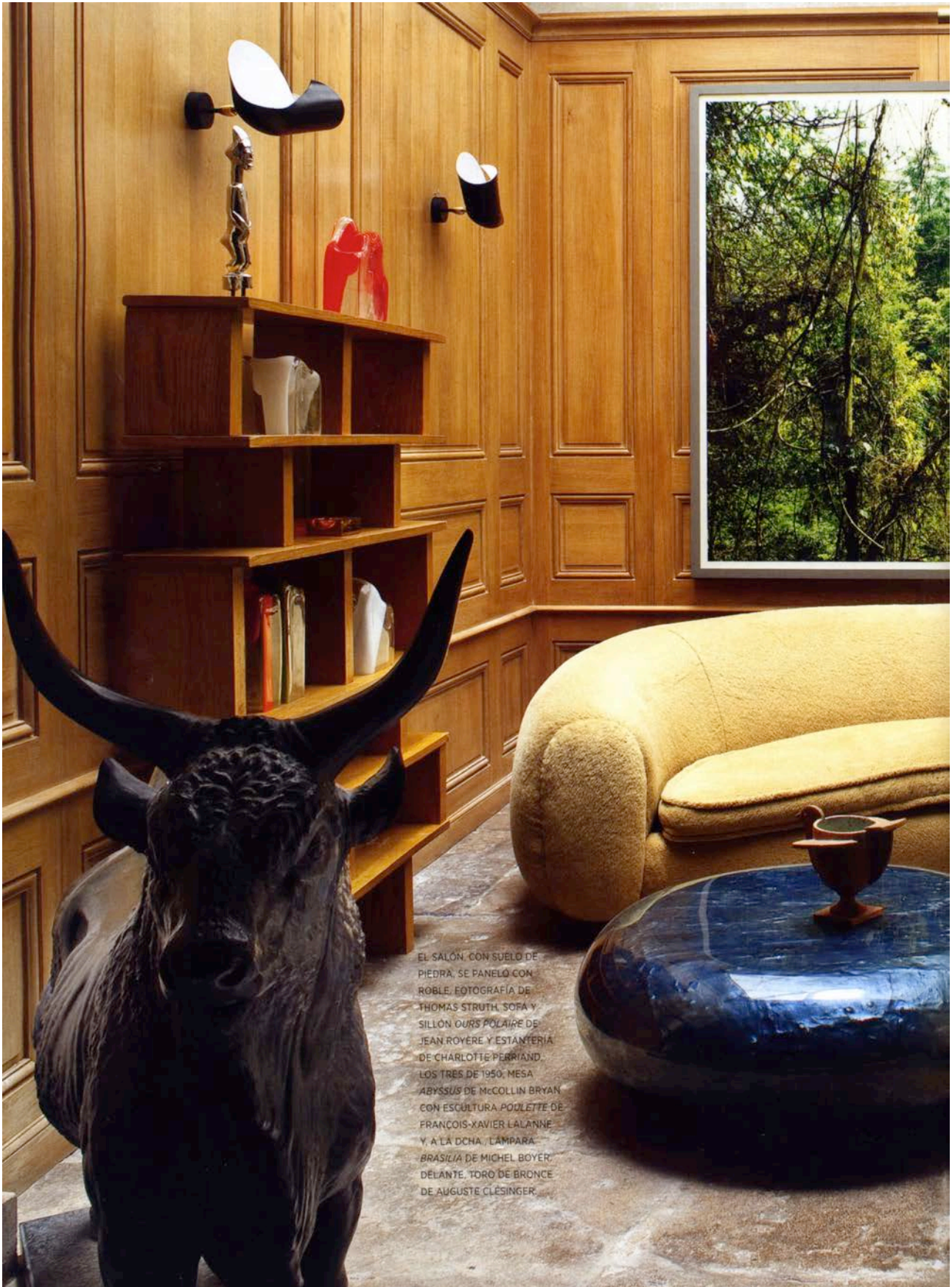
EL SALÓN, CON SUELO DE PIEDRA, SE PANELO CON ROBLE. FOTOGRAFÍA DE THOMAS STRUTH. SOFA Y SILLÓN OURS POLAIRE DE JEAN ROYERE Y ESTANTERÍA DE CHARLOTTE PERRIAND. LOS TRES DE 1950. MESA ABYSSUS DE MCCOLLIN BRYAN CON ESCULTURA POULETTE DE FRANÇOIS-XAVIER LALANNE Y A LA DCHA, LÁMPARA BRASÍLIA DE MICHEL BOYER. DELANTE, TORO DE BRONCE DE AUGUSTE CLÉSINGER.