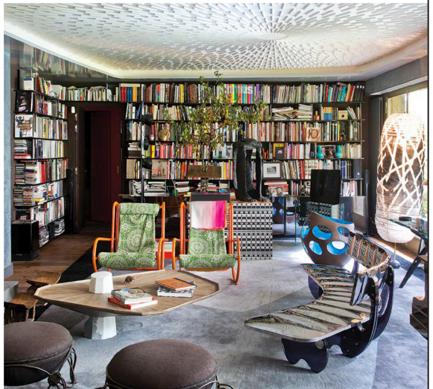
Динамичную оптическую иллюзию на потолке в гостиной создаёт узор в виде 1700 белых деревянных брусков-пунктиров, имитирующих расходящиеся в разные стороны солнечные лучи.