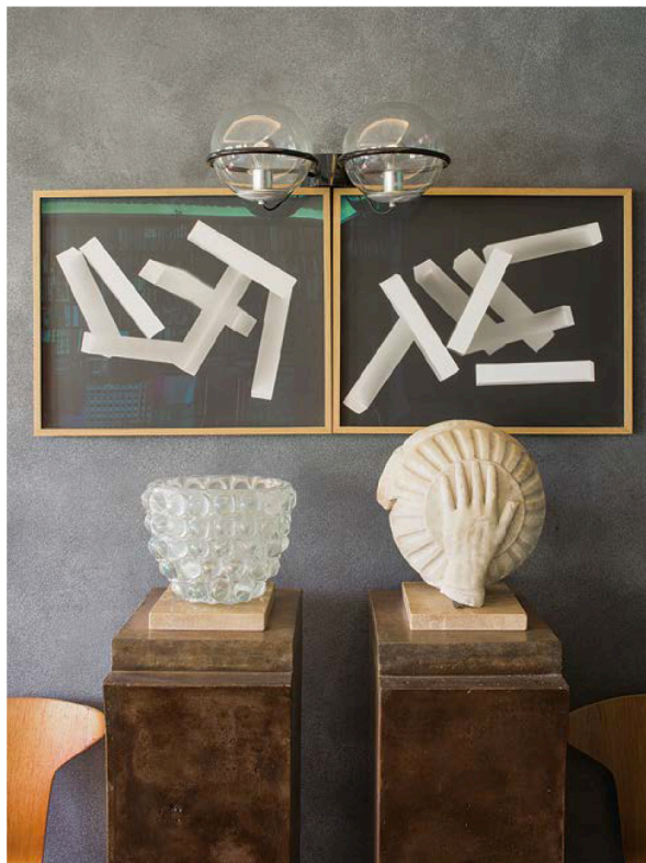
На стене в гостиной — фотоработы Флориана Ротмайера из галереи Nicolas Silin.