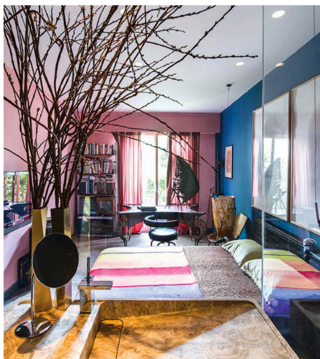
Спальня, по словам дизайнера, «одновременно горячая и холодная вселенная», созданная благодаря голубой и розовой стене. Дополняет интерьер медового цвета ванная из оникса, спрятанная за стеной перегородкой.