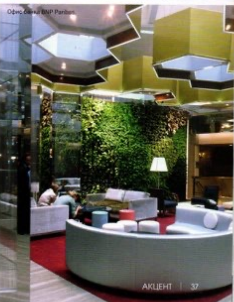
Офис банка BNP Paribas