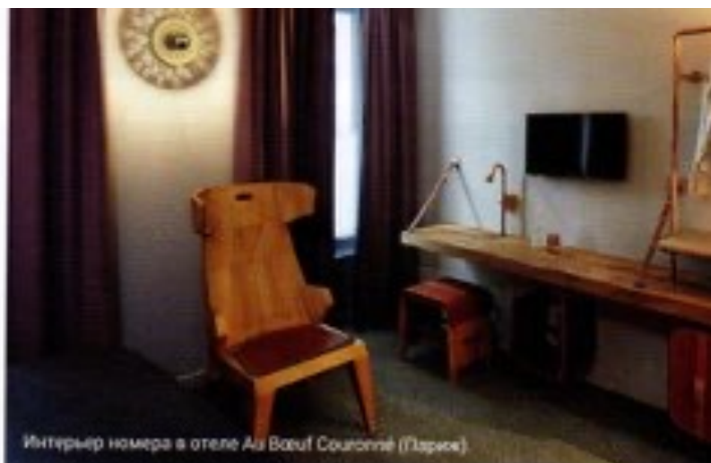
Интерьер номера в отеле Au Bœuf Couronné (Париж)