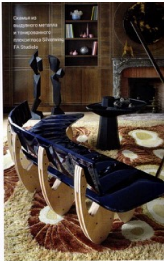
Скамья из выдувного металла и тонированного плексигласа Silverwing FA Studiolo