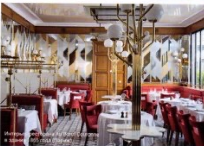
Интерьер ресторана Au Bœuf Couronné в здании 1905 года (Париж)

Кофейный столик Webwood со столешницей из оregonской сосны на мраморном основании FA Studios.